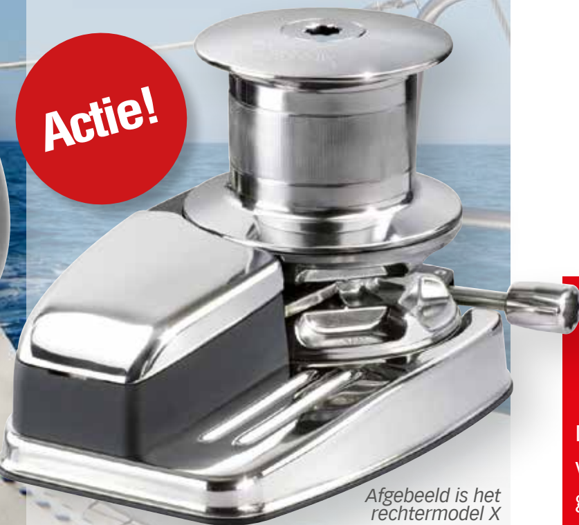
Afgebeeld is het rechtermodel X

De Dave ankerlier is een verticale ankerlier, perfect voor boten met beperkte dekruimte. De ankerlier is gemaakt van RVS316 AISI. Dit apparaat wordt geleverd in verschillende variaties, zoals met of zonder verhaalkop en diverse kettingschijfmaten. Voorzien van een IP67 waterdichte motor, geanodiseerd aluminium tandwiel, handmatig vrijval systeem en een inspectiedeksel. Deze unit wordt compleet geleverd met bedieningsrelais, lierhendel en montage materiaal. U heeft de keuze om de ketting aan de rechter- of de linkerkant te laten binnenkomen. Dit is gezien vanaf de voorkant van het schip. Bij bestelling graag de kettingschijfmaat opgeven. De keuze kan niet achteraf aangepast worden, bij het bestellen zal er expliciet een specifiek artikelnummer besteld moeten worden.